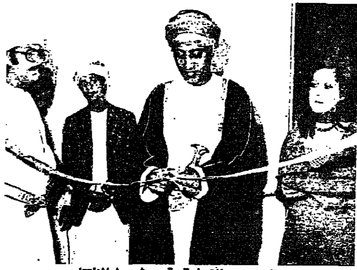
معالي وزير التجارة يقص شريط الافتتاح

احتفل تحت رعاية معالي الاستاذ محمد الزبير وزير التجارة والصناعة امس الاول بافتتاح شركة التأمين الوطنية العمانية بعقر الشركة بطرح الكبرى . وحضر حفل الافتتاح عدد من كبار المسؤولين والسفراء المعتمدين لدى السلطنة . ويذكر ان الحكومة العمانية تساهم في رأس مال هذه الشركة التي ستساهم في دفع عجلة الاقتصاد والتنمية في البلاد الى الامام .